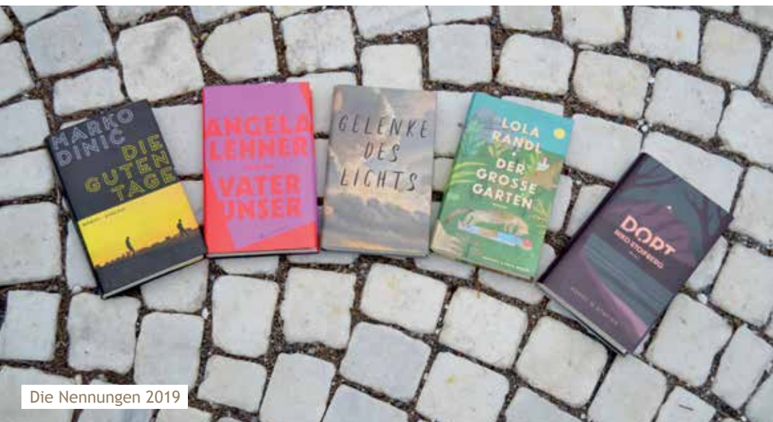
Die Nennungen 2019